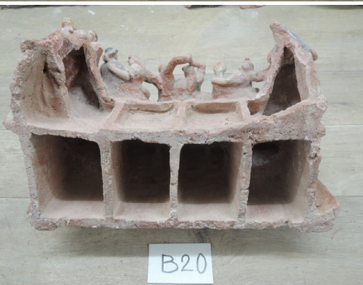
Zadní strana kachlu tvořícího spodní část scény „Tanec kolem májky“ před odstraněním cementu a po něm.

se nacházejí „Summadokn“ (obchůzka děvčat s Létem), tanec kolem májky neopatřený popiskem, nýbrž úryvkem skladby Für unna Hoamat älls , dále „Tãudastrog“ (vynášení Smrtky chlápce), „Austnreit“ (mužská velikonoční jízda před mší o Zmrtvýchvstání Páně), „Kãnasfeiarl“ (svatojánský oheň), „Da Eldansegn“ (rodičovské požehání snoubencům), „Da Kammawogn“ (plundrování, tj. převoz nevěstiny výbavy) a „Di Kindstaf“ (domácí oslava křtu, pohoštění kmotrů, porodní báby a nejužší rodiny po návratu z kostela). Na druhé z krátkých bočních stěn jsou umístěny „Sichliach“ (příjezd posledního vozu se sklizní ozdobeného věncem z klasů a květů, po němž následovala modlitba a obřadní odložení kos a srpů), „s Ertekranz“ (proslovem nebo písničkou provázené předání dožinkového